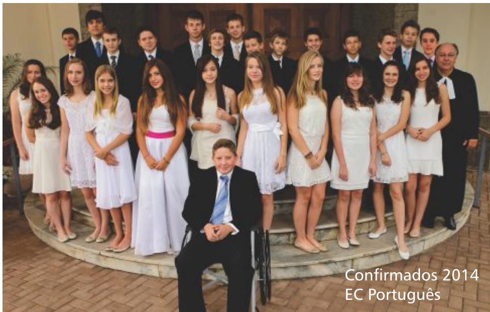
Confirmados 2014 EC Português